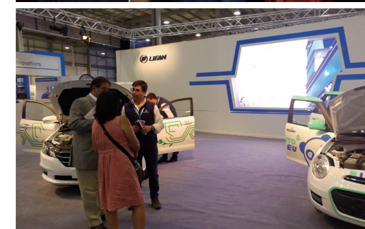
中国-拉美贸易展览会