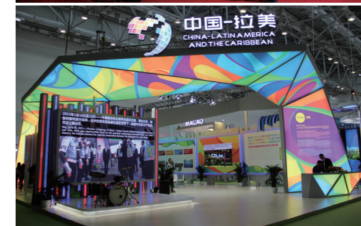
珠海中拉国际博览会