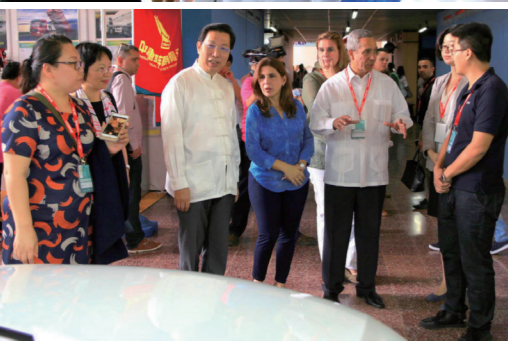
古巴哈瓦那国际贸易博览会现场

2017年10月30日至11月3日，古巴哈瓦那举办了第35届古巴哈瓦那国际贸易博览会，中国国际商会负责该展的组织实施工作。