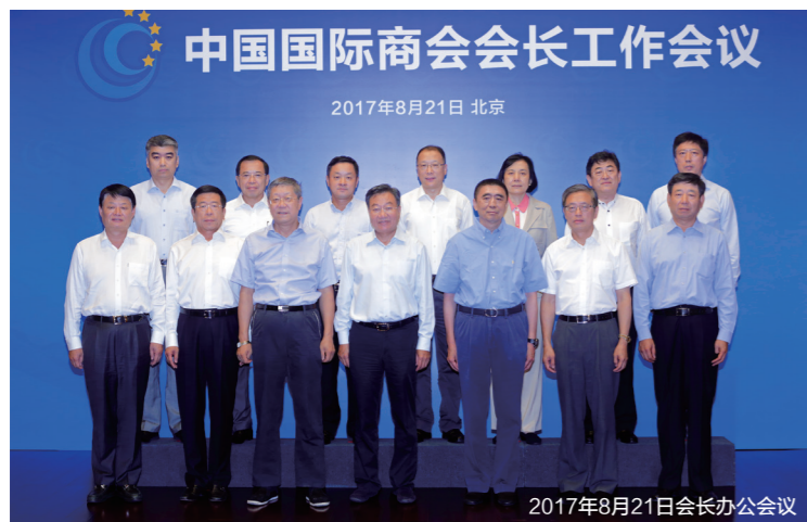
2017年8月21日会长办公会议