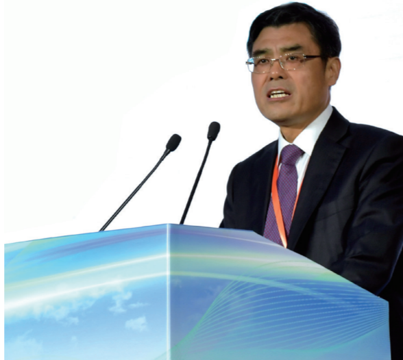
国家电网公司董事长、B20中国工商理事会主席舒印彪代表中国工商界响应“一带一路”建设

雄安新区一方面对企业的调研给予了“一对一”的精准回复;另一方面,雄安新区希望中国贸促会和中国国际商会能够发挥自身优势,组织更多高端高新技术企业参与雄安新区建设。