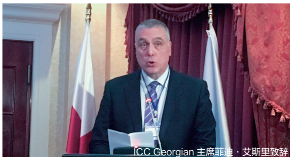
ICC Georgian 主席菲迪·艾斯里致辞

2017年11月30日,由国际商会格鲁吉亚国家委员会(ICC Georgia)和国际商会中国国家委员会(ICC China)共同举办的丝绸之路区域贸易金融技术论坛在格鲁吉亚第比利斯成功召开。