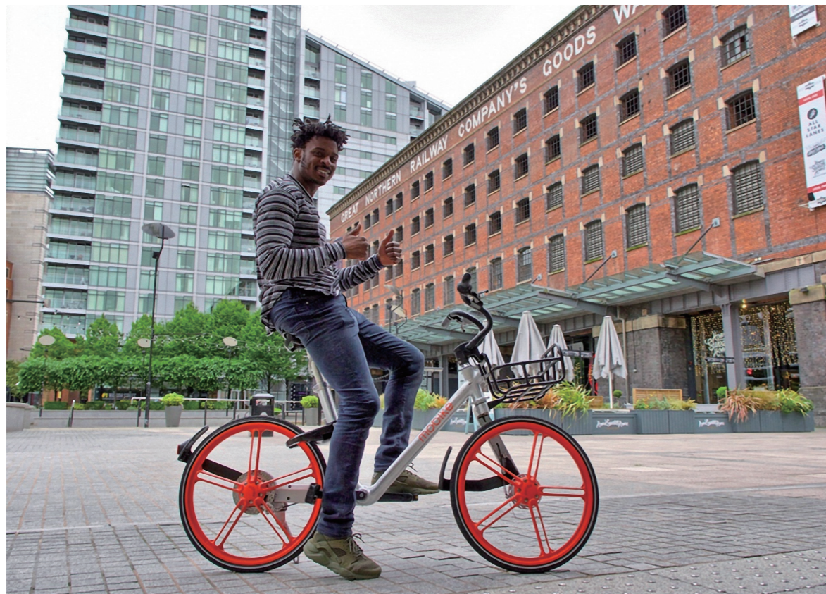
摩拜100城 - 曼彻斯特

2017年3月21日,在中国传统节气春分日刚过,摩拜单车即正式宣布进军新加坡这个国外华人市场,正式开启摩拜单车的国际化扩张之路。摩拜单车仅用时6个月就完成了2017年初计划入驻全球100座城市的目标,随后将目标提升为全球200城。11月21日,摩拜宣布进入德国首都柏林,至此摩拜单车共进入12个国家的200座城市。