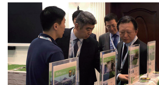
中国贸促会、中国国际商会副会长陈洲率团参展