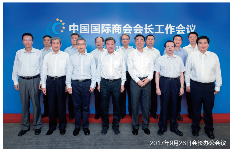
2017年9月26日会长办公会议