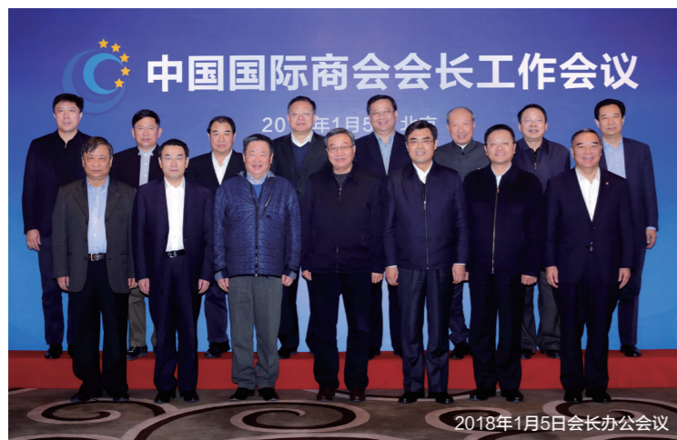
2018年1月5日会长办公会议

中国国际商会现有82家副会长单位在各自行业中都是排头兵和旗帜，是共和国的脊梁和“国家队”，在国内外都有巨大影响力。2017年，商会创新服务形式，以召集会长办公会议的形式，倾听副会长单位呼声与建议，同时搭建一个副会长单位之间的交流平台。