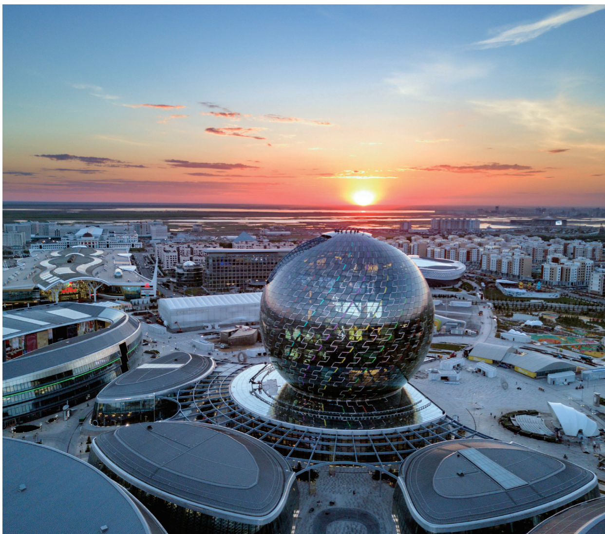
阿斯塔纳世博会园区