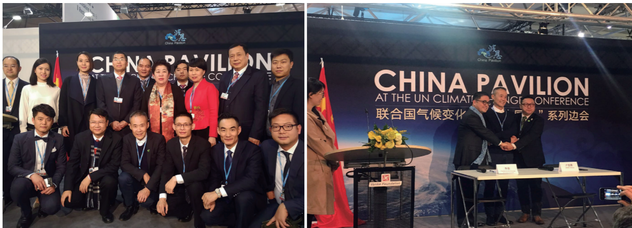
万科率团参加气候大会

作为中国国际商会副会长单位、国内最大房地产企业之一，万科对于境外已有布局，其境外布局起始于2013年。当年伴随着境内房地产投资回报率的降低，中国房企开始在境外寻求合适的投资标的。时至今日，万科已进入美国、新加坡、英国等国家。